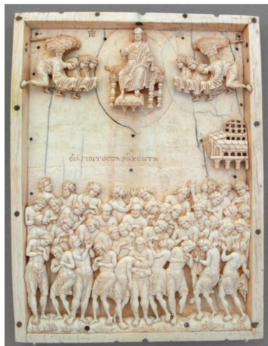
icône des 40 martyrs de Sébaste ; ivoire 10e siècle Constantinople, aujourd'hui au musée Bode de Berlin

Les noms de ces martyrs nous sont connus : Acace, Aétius, Alexandre, Angias, Athanase, Candide (ou Claude), Cyrille, Dométien, Domnus, Ecdikios, Elie, Eunoïque, Eutychius, Flavius, Gaius, Gorgonius et un autre du même nom, Hélien, Héraclius, Hésychius, Jean, Khoudion (Léonce), Lysimaque, Méléce, Méliton, Nicolas, Philoktimon, Priscus, Quirion, Sacerdon, Sévérien, Sisinius, Smaragde, Théodule, Théophile, Valens, Valère, Vivien, Xanthias et Aglaïos le garde.