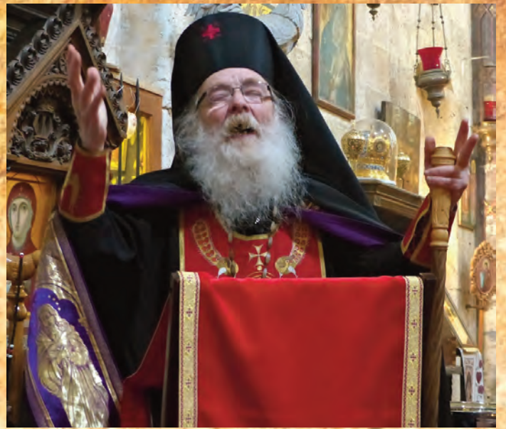
Procession de la Croix et de sa Relique