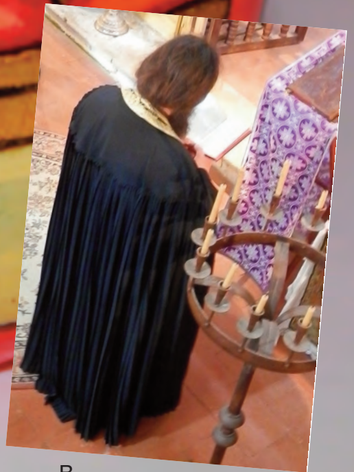
Lecture Vendredi Saint