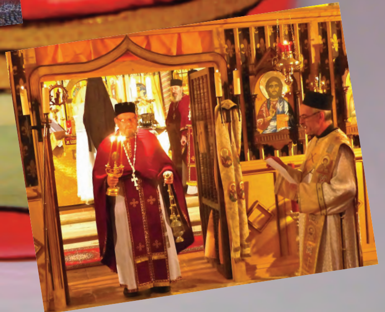
Lecture Nuit de Pâques