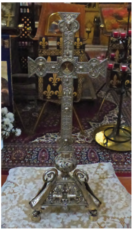
Reliques de la vrai Croix