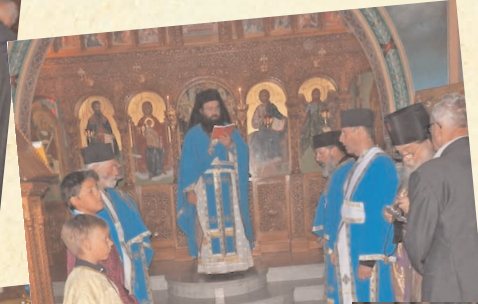
15 août à Tarbes. Fête de l'icône de Notre Dame Reine de France.