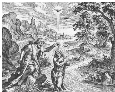
Baptême de Notre Seigneur Jésus Christ dans le Jourdain par st Jean-Baptiste

20H : Divine Liturgie de la Nativité du Christ, suivie des Agapes fraternelles.