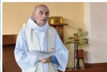
Père Jacques Hamel

« Tu es, en effet, Seigneur, le secours des sans-secours, l'espérance des désespérés... Sois tout pour tous, toi qui connais chacun, ses prières, sa famille, ses nécessités. » (Extrait de la Liturgie de saint Basile)